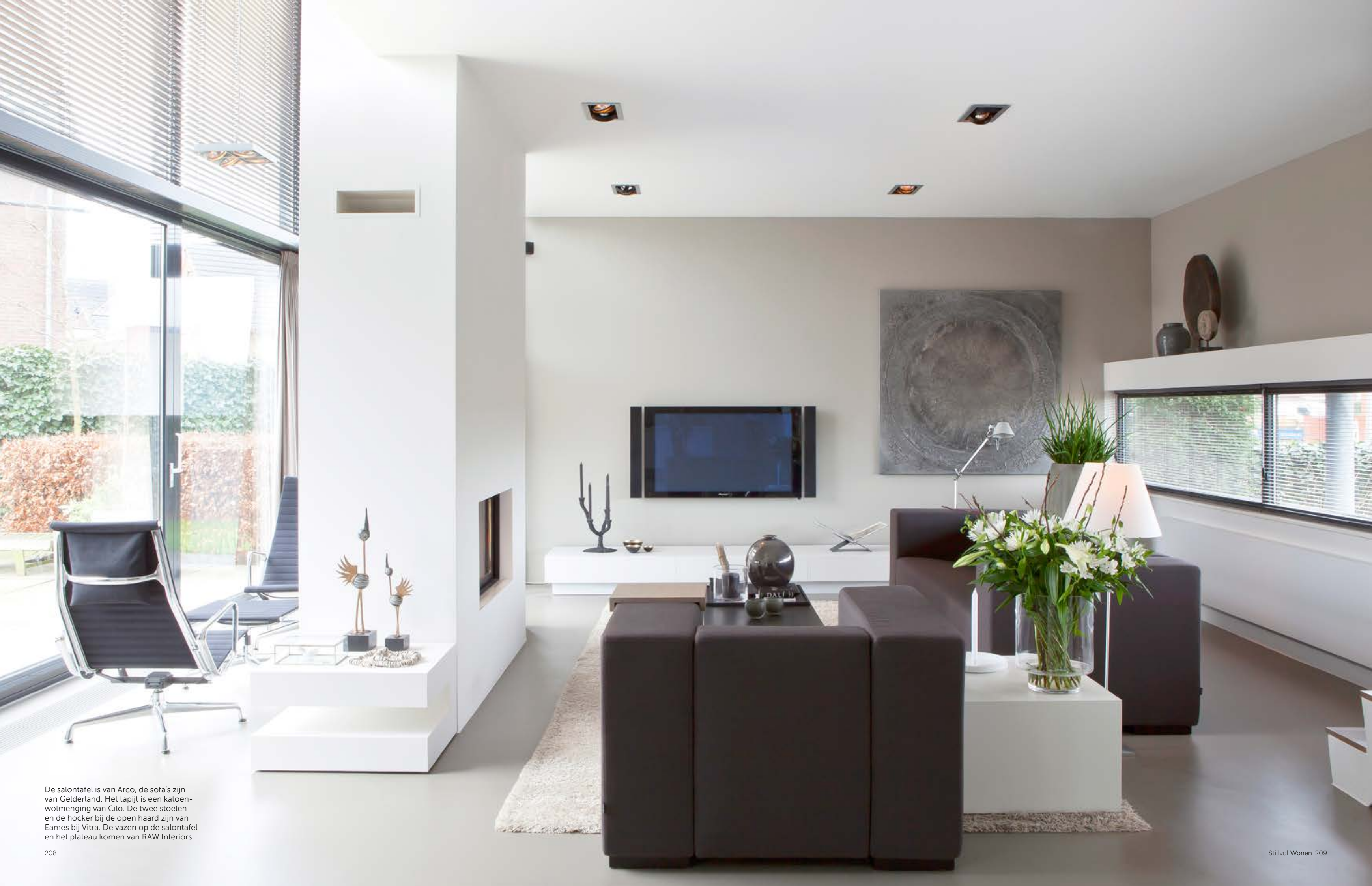
De salontafel is van Arco, de sofa's zijn van Gelderland. Het tapijt is een katoenwolmenging van Cilo. De twee stoelen en de hocker bij de open haard zijn van Eames bij Vitra. De vazen op de salontafel en het plateau komen van RAW Interiors.