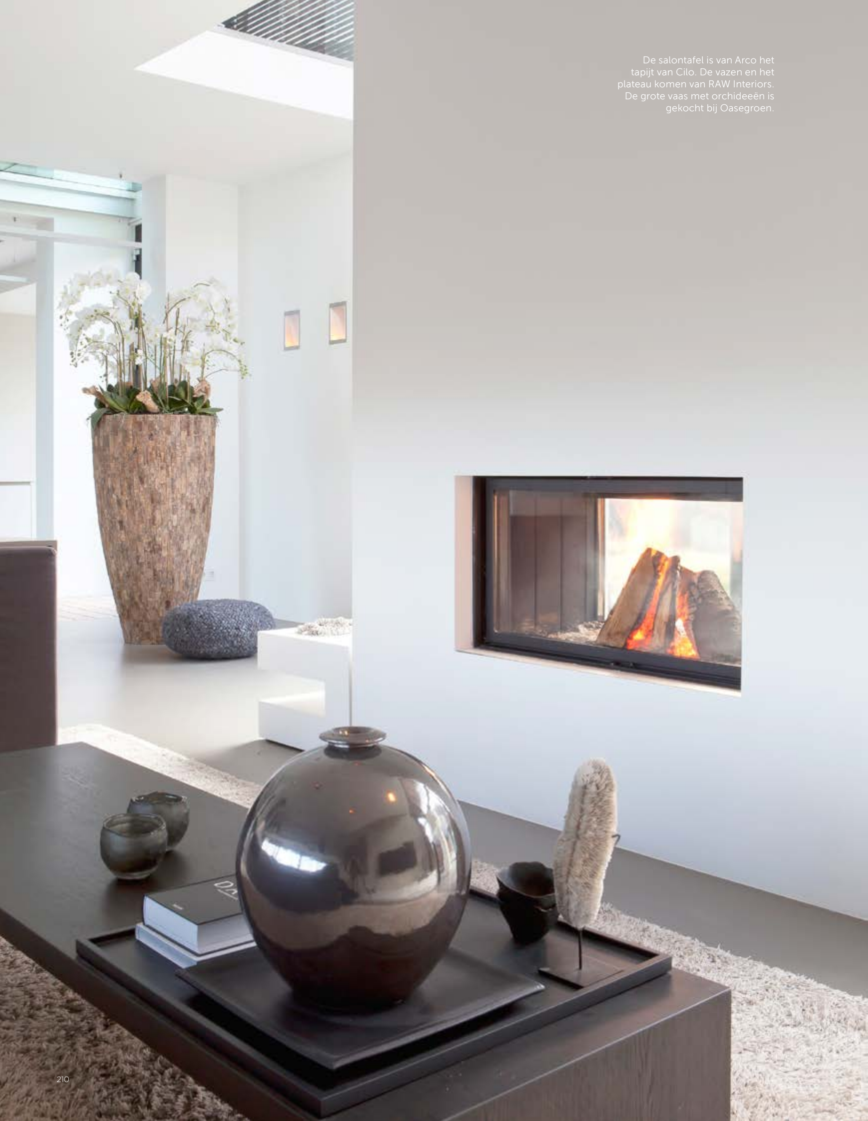
De salontafel is van Arco het tapijt van Cilo. De vazen en het plateau komen van RAW Interiors. De grote vaas met orchideeën is gekocht bij Oasegroen.