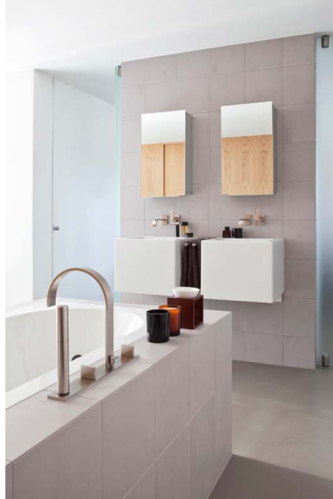
Het bad is van Villeroy & Boch, de kranen zijn van Dornbracht, de vierkante wasbakken van Simas. Alle geur- en badproducten zijn van Skins Cosmetics in Oosterbeek.